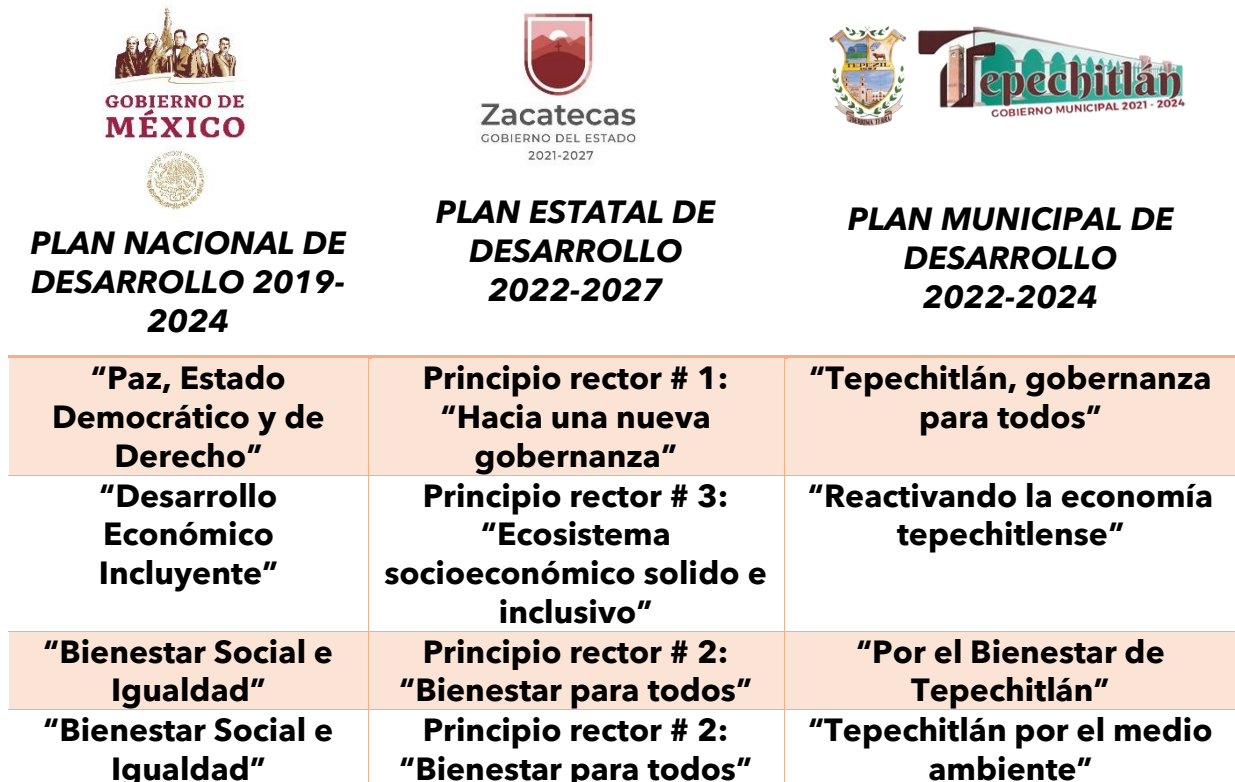
TABLA: ALINEACIÓN CON LA DIRECTRICES FEDERALES, PLAN ESTATAL Y SU CONCORDANCIA CON EL MUNICIPAL